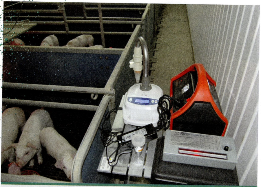
Un appareillage sophistiqué permet de mesurer la présence des bactéries et d'autres particules présentes dans l'air des bâtiments d'élevage.

Ce pathogène a la propriété de se disperser dans l'air, sous forme d'aérosol, et de pouvoir être inhalé.